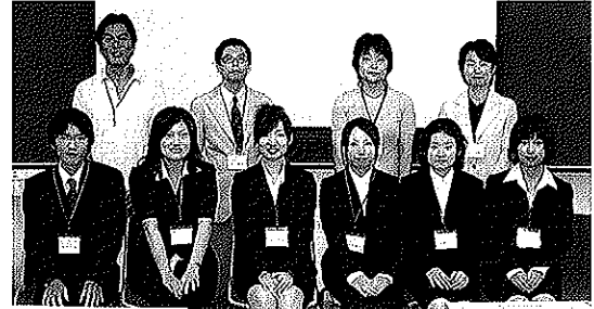
発表の皆さんとご指導の先生方